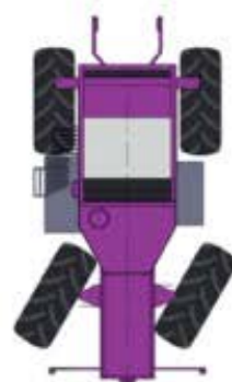
Только задними колесами