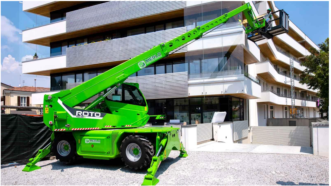
Merlo ROTO R40.18