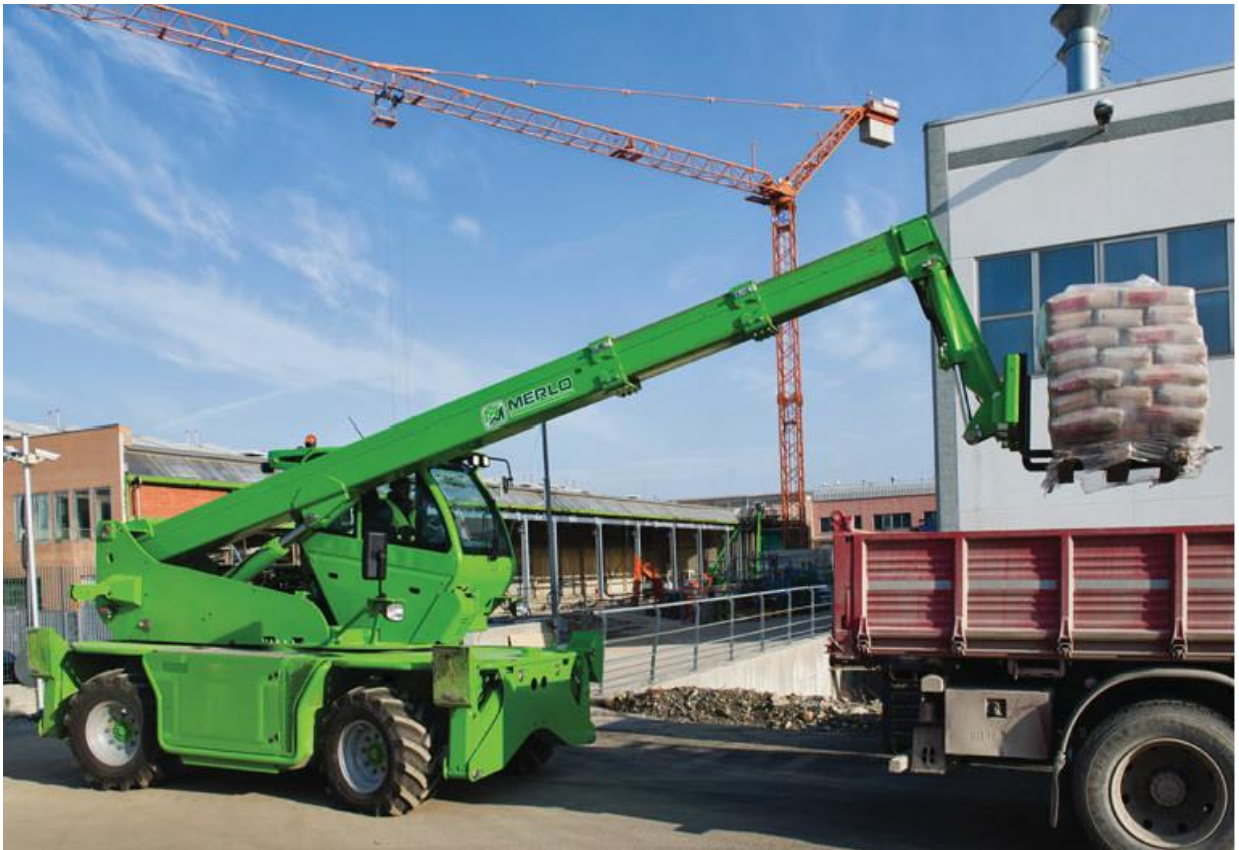
Merlo ROTO R40.16EE