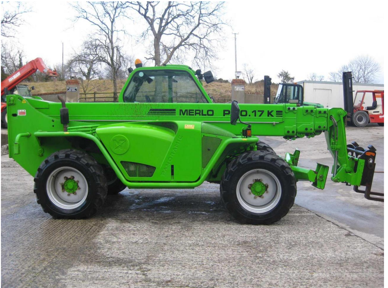
Merlo PANORAMIC P40.17